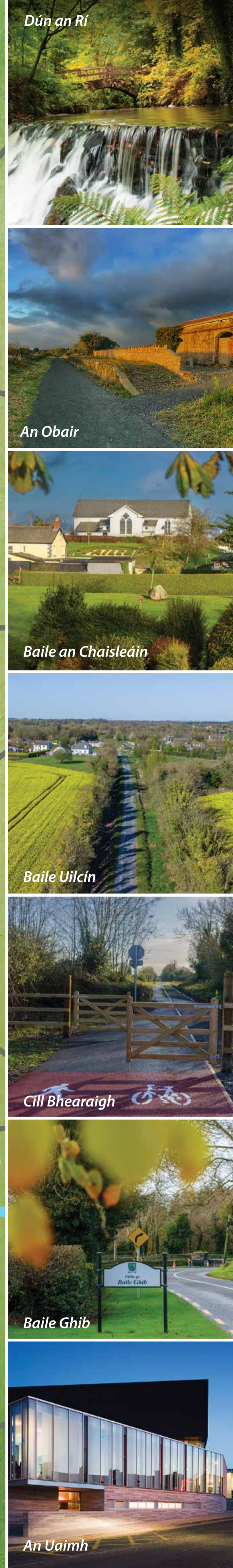
Dún an Rí